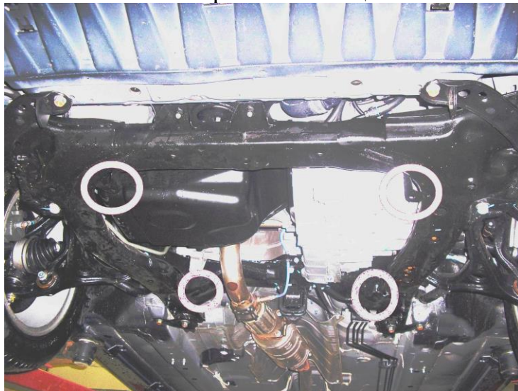
Места крепления защиты

Защита устанавливается поверх штатного пыльника.