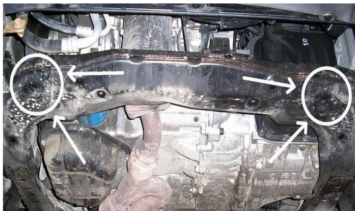
МЕСТА УСТАНОВКИ ШПИЛЕК