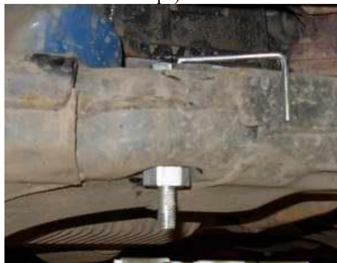
Установлена правая (со стороны пассажира) шпилька