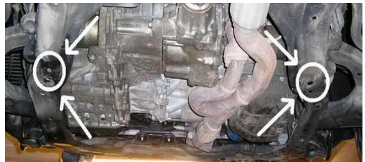
МЕСТА УСТАНОВКИ ПЛАСТИН