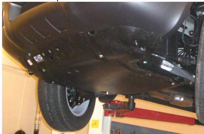
ЗАЩИТА НА АВТОМОБИЛЕ