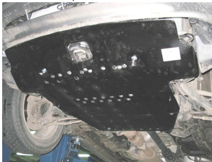
Защита на автомобиле.