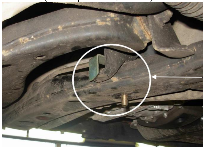
Заднее левое крепление защиты (со стороны водителя).