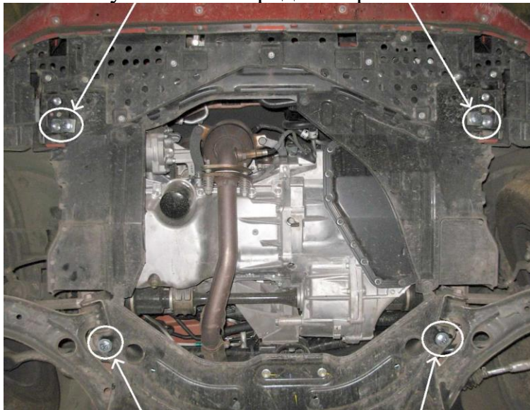
Места установки передних кронштейнов.