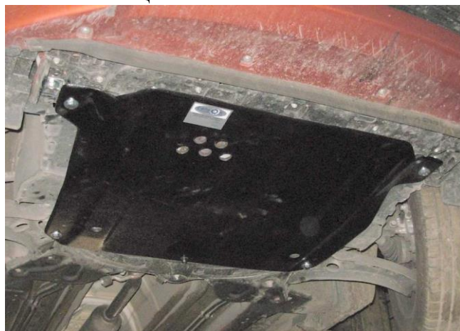
Защита на автомобиле.