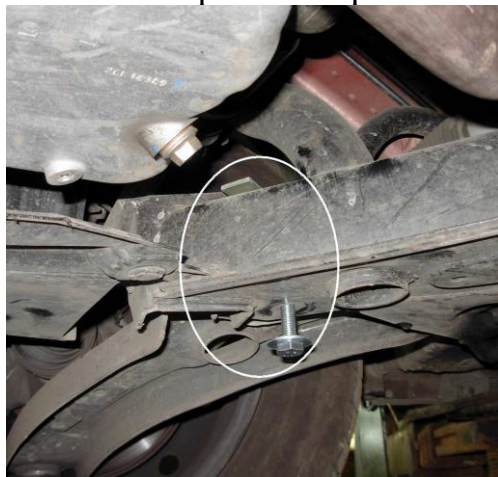
Место установки заднего крепления с пассажирской стороны.